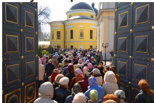
Очередь к мощам Матроны в Покровском монастыре (г.Москва)

Источники: 1) https://www.pokrov-monastir.ru/matrona/zhitie-blazhennoy-staritsy-matrony , 2) https://days.pravoslavie.ru/Life/life4629.htm