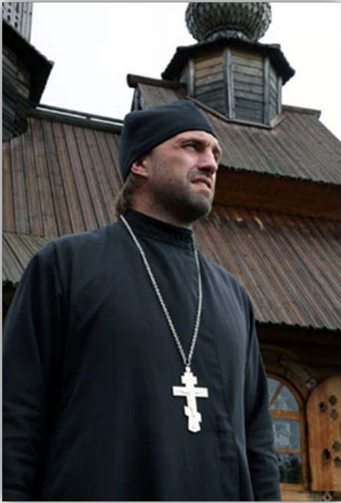
Владимир Вдовиченков в фильме «Искупление»

- Для меня вера в Бога – это ещё и определённое умение отрекаться от каких-то клише и штампов. Бывает, что видишь: человек – гад, сволочь конченная. Но не зря же Библия говорит: «Полюби ближнего, как самого себя». Попробуй понять, попробуй оправдать, попробуй понять, почему с этим человеком так происходит, почему он стал таким, почему он так себя ведёт. И может